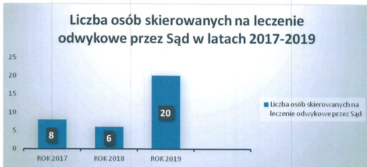
Wykres nr 1

Wykres nr 2 obrazuje ilość prowadzonych postępowań przygotowawczych w związku z popełnionym czynem art.207 kk.